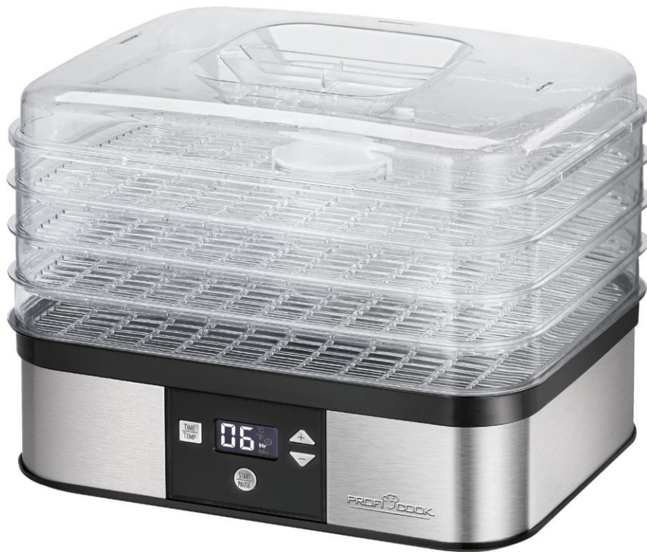
Toidukuivataja PC-DR 1116