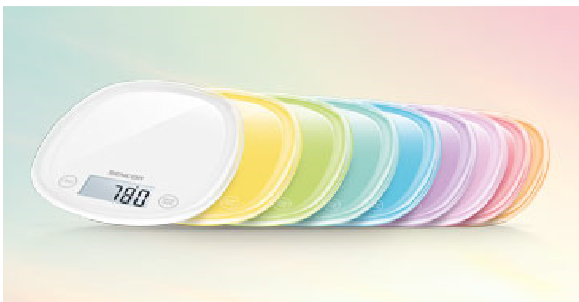
Köögikaal SKS3.... - seeria