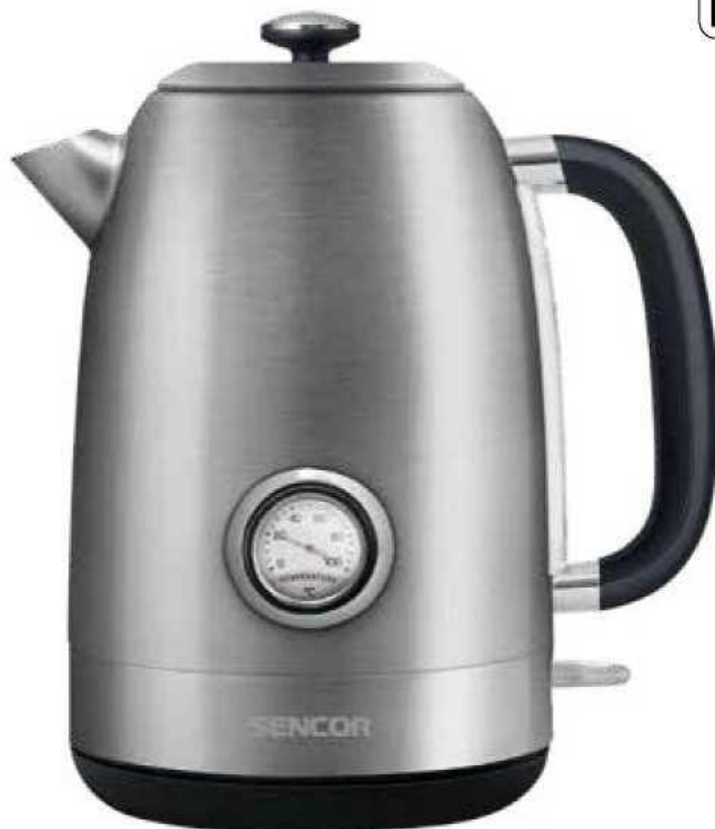
Elektriline veekeetja Originaaljuhendi tõlge